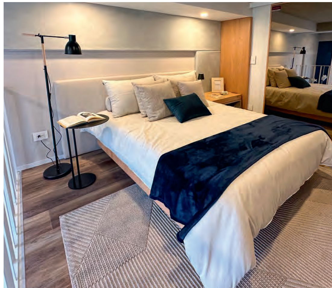
Foto Apartamento modelo tal como se entrega. estas imágenes son representaciones gráficas, artísticas e ilustrativas que pueden presentar variación en diseño, forma y/o acabados y se presenta con el único objetivo de servir como referencia sobre los espacios que aquí describen. El producto final puede tener variación.