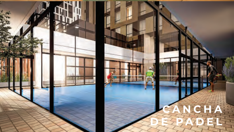
CANCHA DE PÁDEL